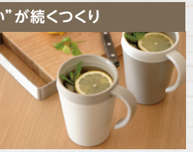
“おいしい”が続くつくり 真空二重構造で飲み物の温度を保ちます。