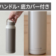
密封構造だから バッグに入れても安心