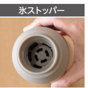
口当たりがいい 氷ストッパー付き