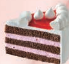
ストロベリーと ラズベリーのケーキ