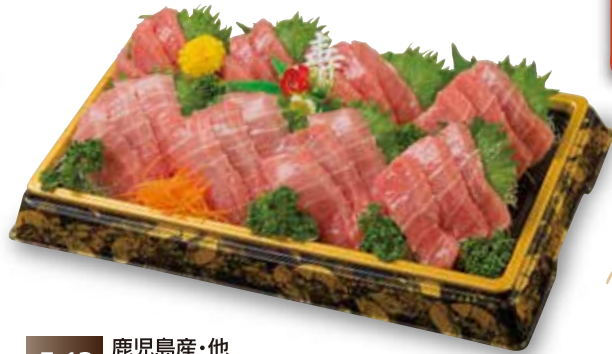
F-13 鹿児島産・他 生本まぐろ(中とろ)づくし刺身(養殖)