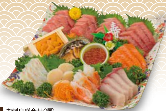
F-12 お刺身盛合せく輝 [9種・12点盛]