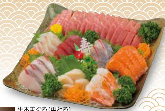
F-11 生本まぐろ(中とろ) たっぷり刺身盛合せく宝箱 [7種・8点盛]

承り期間:12月25日(日)まで ※特定原材料:小麦・えび ※消費期限:お渡し日当日 お渡し日:12月31日(土)のみ