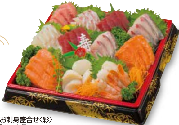
F-14 お刺身盛合せく彩 [7種・11点盛]

承り期間:12月25日(日)まで ※特定原材料:えび ※消費期限:お渡し日当日 お渡し日:12月31日(土)のみ