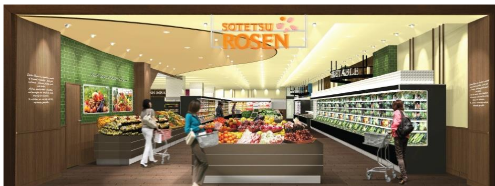
「そうてつローゼン伊勢原駅前店」(店内イメージ)

お客様の暮らしがより便利でゆたかに、そして快適にお買い物を楽しんでいただけるように地域のお客様にあった品揃えをするとともに、駅前立地を意識して短時間でお買い物が出来る売場づくりで、お客様がニコニコ笑顔でお買い物していただけるスーパーマーケットを目指してまいります。