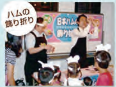
楽しくおいしく食べる飾り折りを親子で体験!