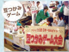
大豆を学ぶコーナーでは豆つかみゲームを開催