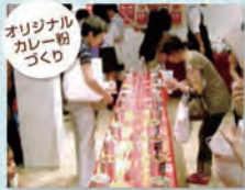
マイオリジナルカレー粉をつくるスパイスを学習!